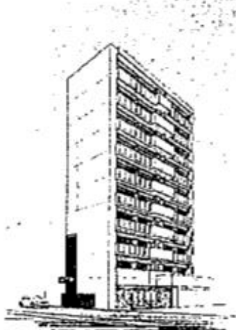
完成外観イメージ図