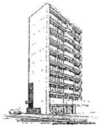
完成外観イメージ図