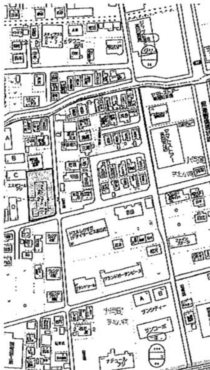
■図面と現況が異なる場合には、現況を優先します。