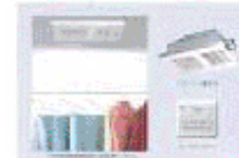
完成予想図の収納スペースの写真です。