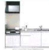
完成予想図のキッチンイメージ