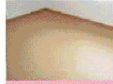
完成予想図の天井と壁のタイプの写真です。