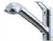
完成予想図の玄関ドアの写真です。