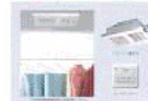
完成予想図の収納イメージ