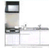
完成予想図のキッチンと洗面台の写真です。