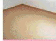
写真予備物の天井タイプの写真です。