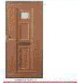
写真予備物の扉タイプ