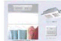
写真予備物の照明タイプです。