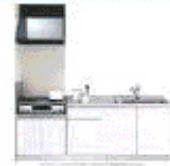
写真予備物のキッチンタイプです。