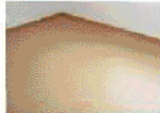
完成予想図の天井タイプ