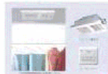
完成予想図の収納スペース