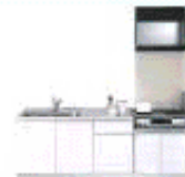
完成予想図のキッチン