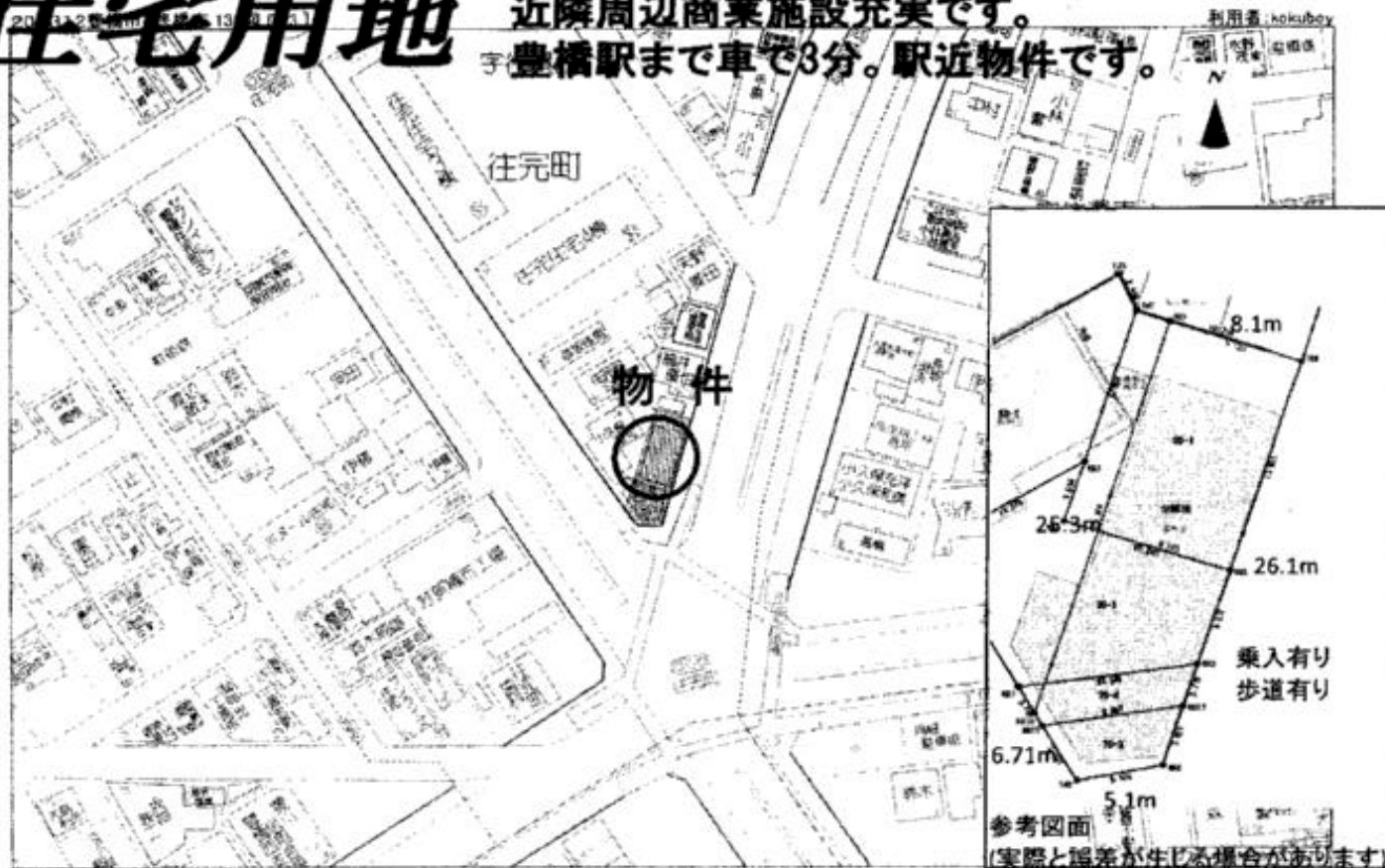
豊橋市往完町字往還西付近