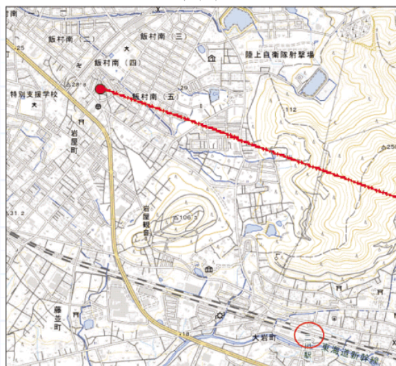
上記地図は、国土地理院図を加工して作成しています